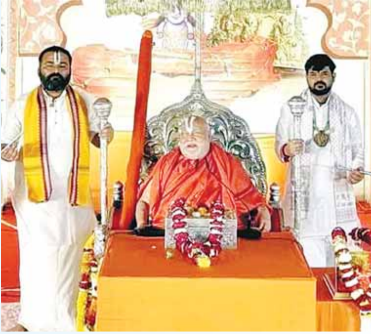
और संस्कृति का आधार है।

चमत्कारिक हनुमान मंदिर जाम सावली में हनुमान जयंती के उपलक्ष में 29 मार्च से लेकर 2 अप्रैल तक जगद्गुरु स्वामी श्री रामभद्राचार्य जी महाराज के द्वारा शाम 4 से 7 बजे तक श्रीरामकथा में भगवान की विभिन्न लीलाओं का बड़े ही सुंदर तरीके से वर्णन किया जा रहा है, विश्व प्रसिद्ध चमत्कारिक हनुमान मंदिर जामसावली, जिसे अब 'हनुमान लोक' के रूप में भव्य स्वरूप दिया जा रहा है, वहाँ इन दिनों अथात्म की अविचल धारा बह रही है।